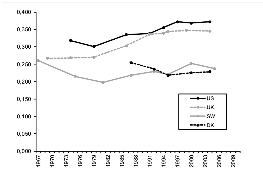
Figur 1. Udviklingen i økonomisk ulighed i USA, Storbritannien, Sverige og Danmark. Gini-koefficientera

a. Ækvivalerede disponible indkomster fra første til sidste LIS-måling.